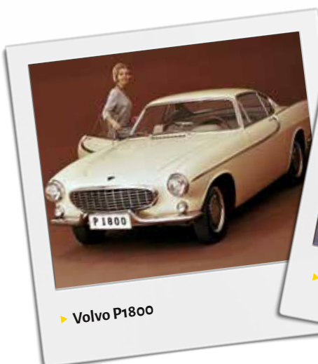
▶ Volvo P1800