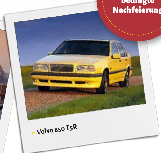
▶ Volvo 850 T5R

Im Herbst 1961 kam der Volvo P1800 auf den Markt, im Spätsommer 1990 dann der Volvo 960 – ein guter Grund, diese Volvo-Typen – coronabedingt verspätet – 2022 zu ihrem 60er bzw. 30er gebührend gemeinsam mit dem Volvo 850 im Rahmen der Volvo-Mania zu feiern!